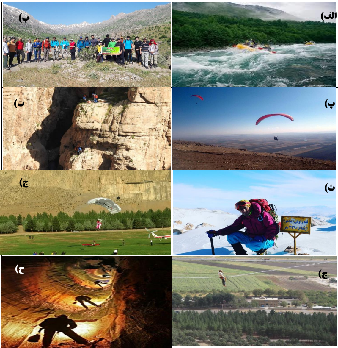
شکل ۳. سایت‌های گردشگری ماجراجویانه در استان کرمانشاه. (الف) رفتینگ در رودخانه سیروان (ب) کوه‌پیمایی در دره سیروله (پ) صخره‌نوردی در آبشار پیران (ت) سایت پرواز ویس القرنی (ث) ارتفاعات شاهو (ج) ورزش‌های هوایی در بیستون (چ) اسلکینگ

در بیستون (ح) غار پرآو، منبع: نگارندگان، ۱۳۹۹