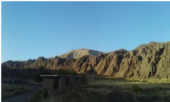
شکل ۱۱. اشکال شبه کندوانی روستای دامنجان،

روستای دامنجان یکی از مناطق متنوع از نظر زمین-شناسی و ژئو مورفو سایت‌ها می‌باشد. که شامل اشکال شبه-کندوانی (توف‌های عظیم آتشفشانی)، معادن سرب و روی، صخره‌های عظیم سنگی که بخشی از آنها در مسیر جاده بار خودنمایی می‌کند و مناظر طبیعی زیبا حاشیه رودخانه بار از جاذبه‌های است که برای هر گردشگر ارزش و اهمیت ویژه-ای دارد. که با اجرای طرح‌های گردشگری زمینه درآمدزایی خوبی فراهم خواهد شد (شکل ۱۱).