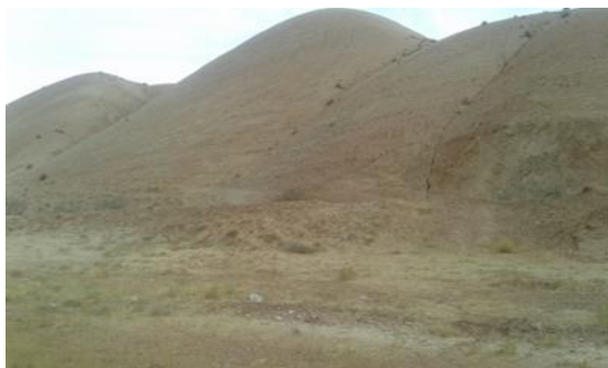
شکل ۶. گنبدهای نمکی روستای وزیریه