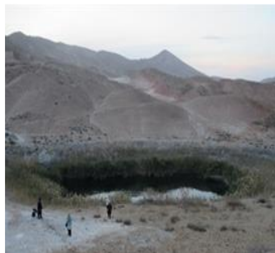
شکل ۵. اشکال شبه کارست در سازند تبخیر روستای زرنده

در سه کیلومتری غرب روستای زرنده از دهستان بینالود، قلّه زیبایی به نام سی سر به ارتفاع ۱۷۵۵ متر وجود دارد. این کوه که از کوه‌های اطراف بلندتر است. این کوه از قسمت‌های مختلفی تشکیل شده است و شبیه به گوستا است صخره‌های آن بسیار جذاب و زیباست. در فاصله ۱۷۰۰ متری جنوب روستای زرنده نیز دریاچه‌های سه‌گانه سی سر واقع شده است که پس از دریاچه بزنگان سرخس دومین آبگیر طبیعی استان خراسان رضوی است که آب آن از طریق چشمه‌های زیرزمینی و آب‌های سطحی ناشی از باران‌های بهاری تامین می‌گردد (شکل ۵).