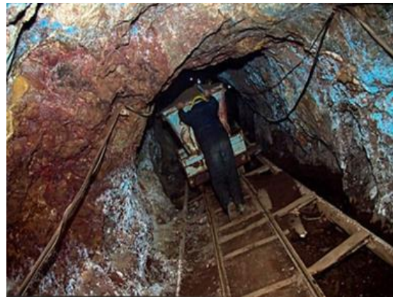
شکل ۲. معدن فیروزه روستای کان فیروزه.

قدیمی‌ترین فیروزه‌ای که تاکنون در دشت نیشابور کشف شده، در منطقه تپه برج ۶۶۰۰ سال قدمت تاریخی دارد. در نتیجه قدمت معدن نیشابوری به صورت مستند نزدیک به ۷ هزار سال می‌رسد و به این ترتیب قدیمی‌ترین معدن فیروزه جهان قلمداد می‌شود (شکل ۲). این معدن از نظر میزان تولید نیز بزرگ‌ترین معدن فیروزه و نیز قدیمی‌ترین معدن فعال جهان است. این معدن در تمام این ۷ هزار سال فعال بوده و مرتب از آن استخراج می‌شده است. با ارزیابی ذخیره‌ای که انجام شده، گفته می‌شود این معدن تا ۲۰۰ سال دیگر قابل استخراج باشد. از سال ۱۳۸۲ این معدن توسط شرکت تعاونی شهر فیروزه، متشکل از ۳۴۲ عضو از وزارت صنعت و معدن به مدت ۲۵ سال اجاره شد.