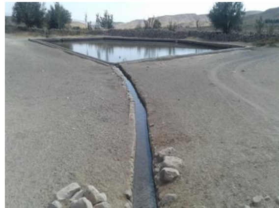
شکل ۹. قنات‌های پلکانی روستای سرچاه،

قنات‌های روستای سرچاه که در حدود ۱۰ قنات دایر و بیش از ۶ قنات مخروبه وجود دارد در شیب دره‌های کوهستانی بصورت پلکانی ایجاد شده‌اند که نفوذ آب در بخش زمین‌های کشاورزی می‌تواند بلافاصله جذب مادر چاه‌های قنات پایین دست خود شود و مهمترین تأمین کننده آب این منطقه می‌باشد (شکل ۹).