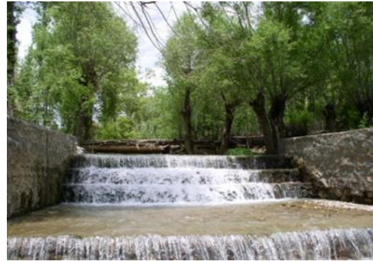
شکل ۸. مناظر طبیعی روستای بقیع، منبع: نگارندگان، ۱۳۹۸

زیبایی را به وجود آورده است که بازدیدکنندگان را به خود جذب می‌نماید. وجود باغات همچنین به سرسبزی بیشتر منطقه و اعتدال آب و هوا نیز کمک کرده است (شکل ۸).