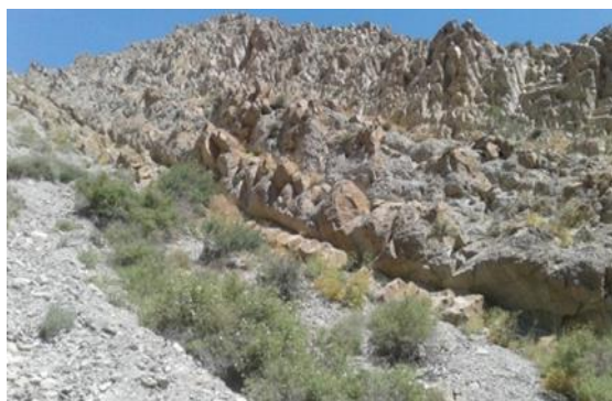
شکل ۷. ساختمان‌های چین و گسل خورده در آهک سازند

در مسیر روستای قرونه به سمت روستای بقیع بعد از باغ‌ها و نرسیده به حصار قلعه سنگ‌های درشت و ریز به صورت مکعبی از دامنه بلندی به پایین و داخل دره فرو ریخته‌اند که اهالی توجهی به آنها نداشتند و بعضا بعد از سیراب کردن گوسفندان در رودخانه در زیر سایه درختان پراکنده محلی گوسفندان را روی این سنگ‌ها می‌خوابانند. برخی از سنگ‌های این منطقه که شکسته‌اند فسیل داخل آنها نمایان است. شکل (۷) سازندهای چین و گسل خورده در آهک سازند لار را نشان می‌دهد.