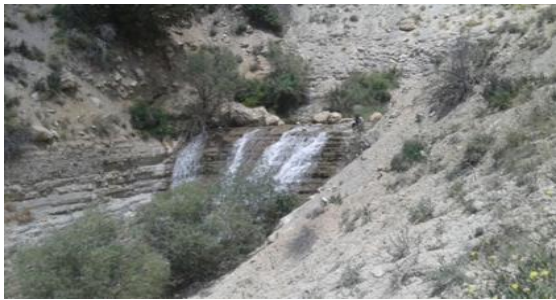
شکل ۳. آبشار دهنه حیدری در بستر رودخانه اندرآب

پناهگاه حیات وحش حیدری با ۷۰ کیلومتر فاصله در شمال و شمال‌غربی شهرستان نیشابور، در مرز با شهرستان‌های قوچان و چناران قرار گرفته است. مسیر دسترسی به پناهگاه حیدری از نیشابور، به سمت شمال بعد از گذر از روستای اندرآب، نصیرآباد، دهنه حیدری (شکل ۳) و همچنین شهر جدید فیروز و معدن سنگ فیروز می‌باشد. پناهگاه حیات وحش حیدری منطقه‌ای است کوهستانی با پوشش گیاهی مناسب و با تپه ماهورهای منفرد و دره‌های نسبتاً عمیق که یکی از بهترین زیستگاه‌های جانوری خصوصاً قوچ و میش و گراز می‌باشد. پوشش درختی غالب منطقه از گونه‌ای سوزنی برگ بومی از خانواده سروها به نام "ارس" است که عمر اغلب آنها بیش از هزار سال است. اشکال مختلف ژئومورفولوژیکی در منطقه در کنار سایر جاذبه موجود منطقه ویژه‌ای را از نظر گردشگری بوجود آورده است (شکل ۴).